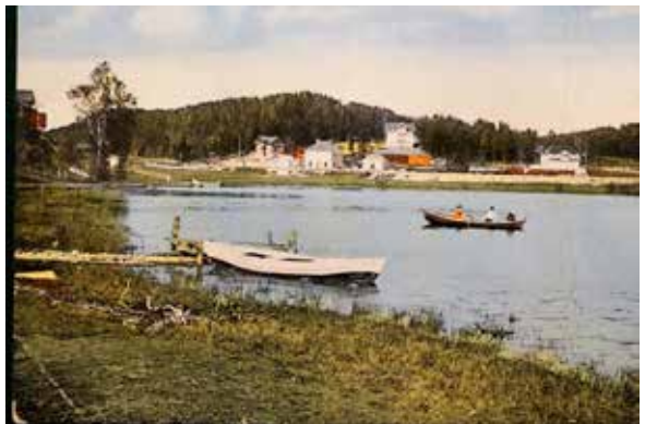
Veslebukta mot Kullebunden,