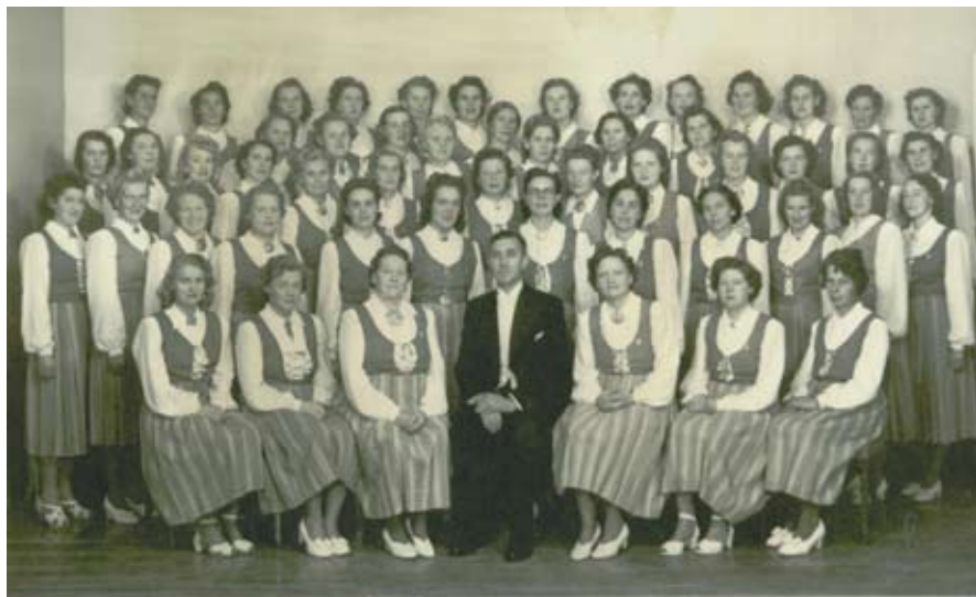
Kolbotn damekor. Stiftet i 1924.

I 1921 får vi den første speidertroppen på Kolbotn og etter hvert også på Oppegård og Myrvoll. Etter krigen blir det også egen tropp på Solbråtan. Først i 1927 kommer pikene med. Etter 1978 er gutte- og pikespeiding slått sammen.