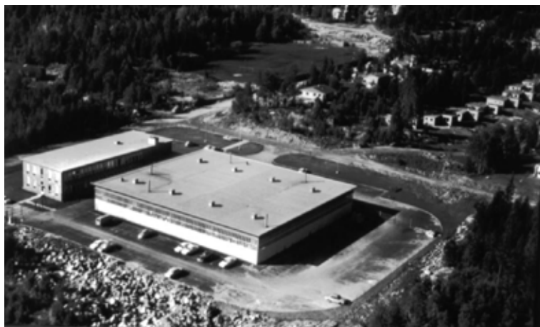
Fords nybygg (1962) som nå huser DFDS. Sofiemyr "stadion" i bakgrunnen

I den siste tiden er det kommet et utall av firmaer til kommunen vår, noen er døgnfluer, men mange består. Handelslekkasjen i kommunen er stor og i disse dager (2004) starter arbeidet med utbyggingen av Kolbotn Vest. Når Kulturhuset er ferdig starter rivingen av Samfunnshuset og ombygging av Solgården for å gi plass til et stort kjøpesenter og en god del boliger.